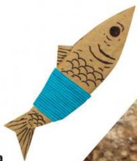
Halia color 460